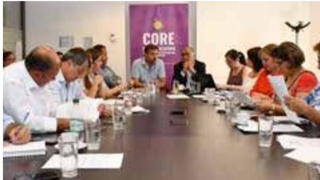
Alcalde Germán Codina participa de Comisión Salud, donde se presentó proyecto de adquisición de 13 vehículos de emergencia para la comuna de Puente Alto.

biando como planeta, es donde debiésemos seguir focalizando la inversión pública en estas materias, para aquellos que menos tienen y más necesitan”.