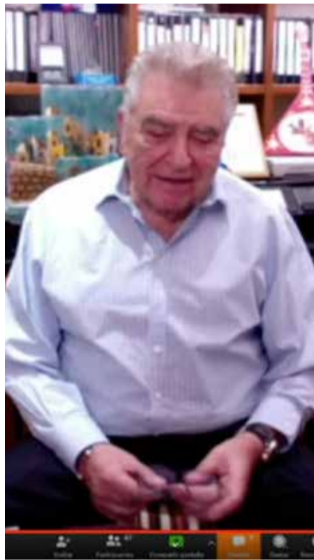
Mario Kreutzberger agradeció al Consejo Regional el apoyo que "siempre le han dado a los niños de la Teletón".

Por su parte, Mario Kreutzberger dijo que "la inclusión es un tema muy importante para nuestros niños. Ellos son muy vulnerables: tenemos 5700 niños que están postrados, 7700 niños con problemas respiratorios, más de 6 mil niños que no se pueden valer por sí mismos. Para todos ellos la inclusión es algo extraordinario, el que puedan pintar, que puedan ir a reunión con sus padres, hacer ejercicios o prepararse para encontrar un trabajo. Por eso muchas gracias a los consejeros regionales por apoyar a los 11 mil niños de la región".