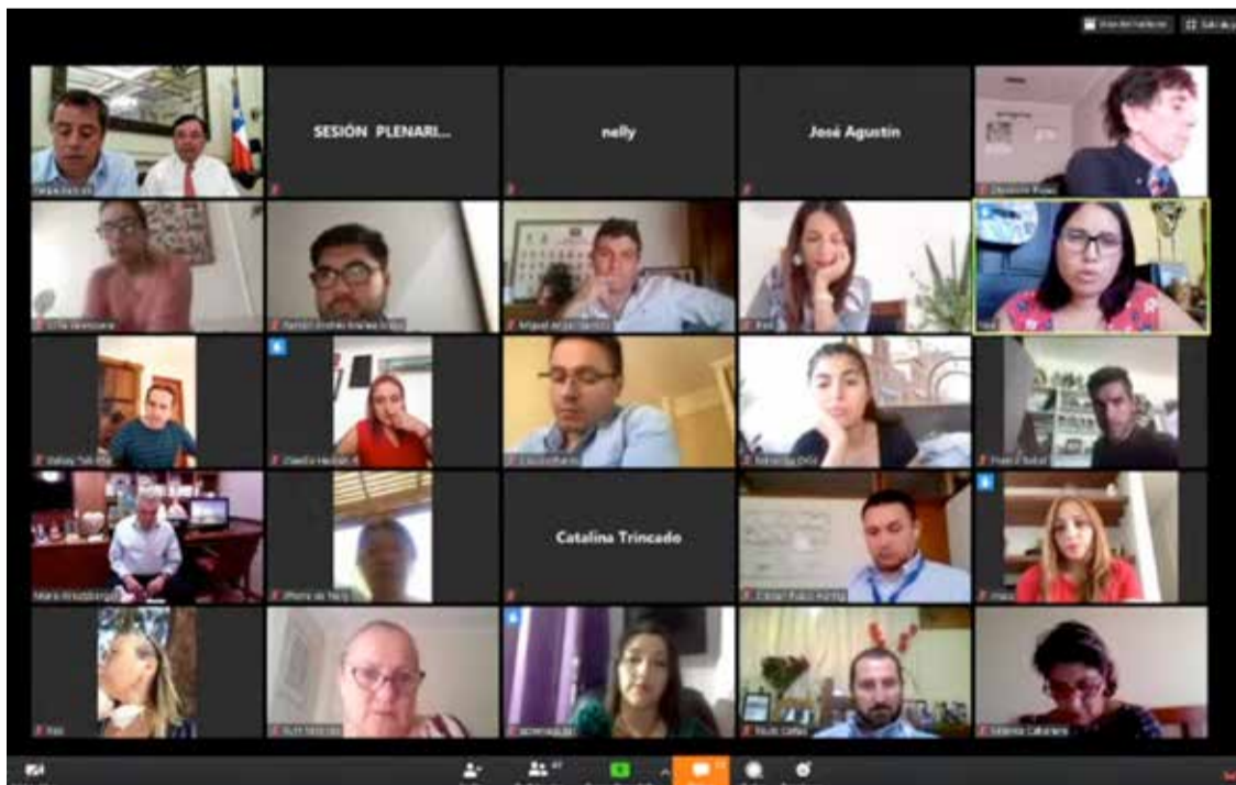
Consejeros Regionales participan en la primera Sesión Plenaria por videoconferencia en la historia del Consejo. Participa también Mario Kreutzberger.