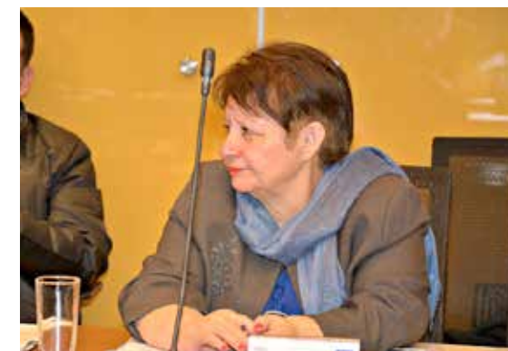
Consejera Mónica Aguilera.