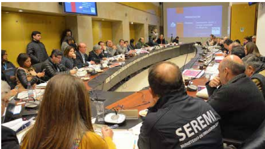
Sesión Plenaria N°11, 7 de junio de 2017.