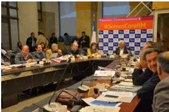
Consejeros en reunión plenaria.