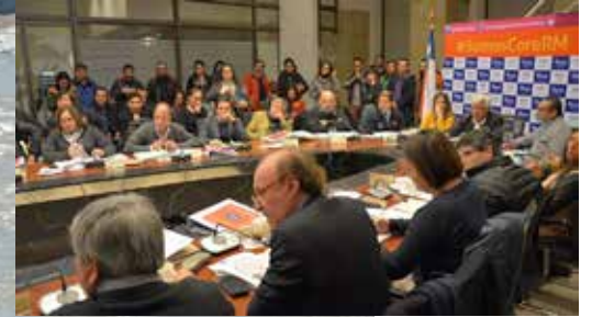
Consejeros y público en Sesión Plenaria N°11.